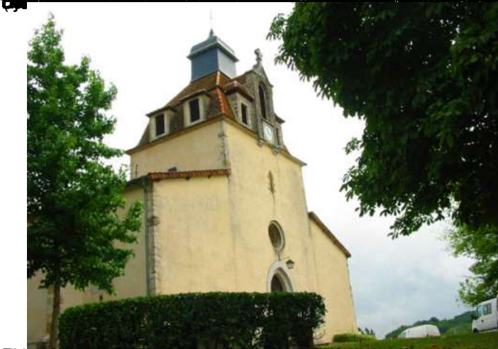
Salies de Béarn Salies-Montiscard Béarn